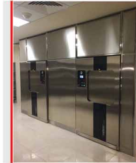
نمونه ای از دیوارکشی استیل بین دستگاه های اتوگلاو